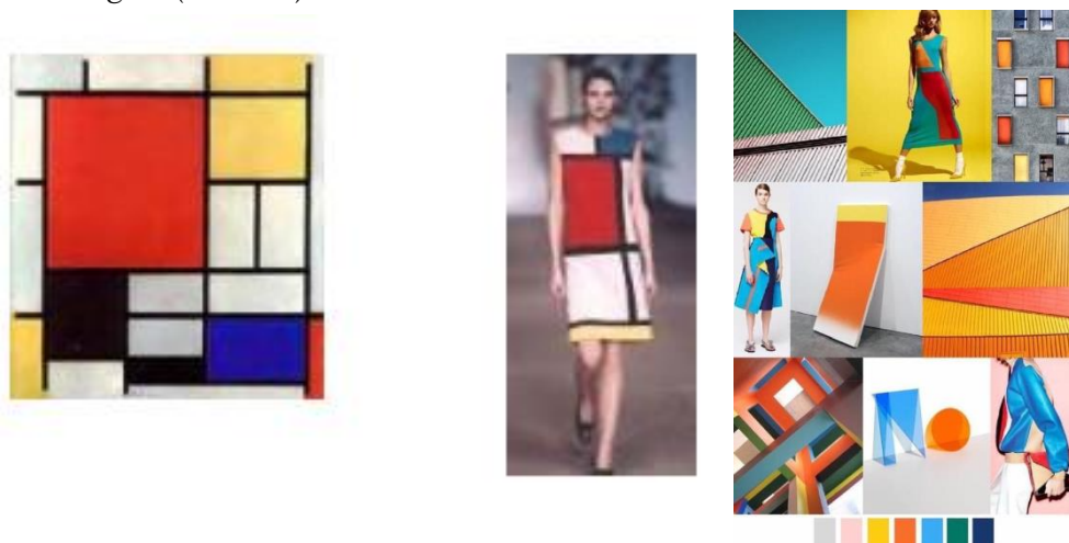
2-rasm. Shaklning zamonaviy tasvirlari

Ko'pincha rassomlarning rasmlari va grafik ishlari bevosita yoki bilvosita shaklning zamonaviy tasvirlari va strukturaviy-dekorativ yechimlarida mujassamlangan (3-rasm).