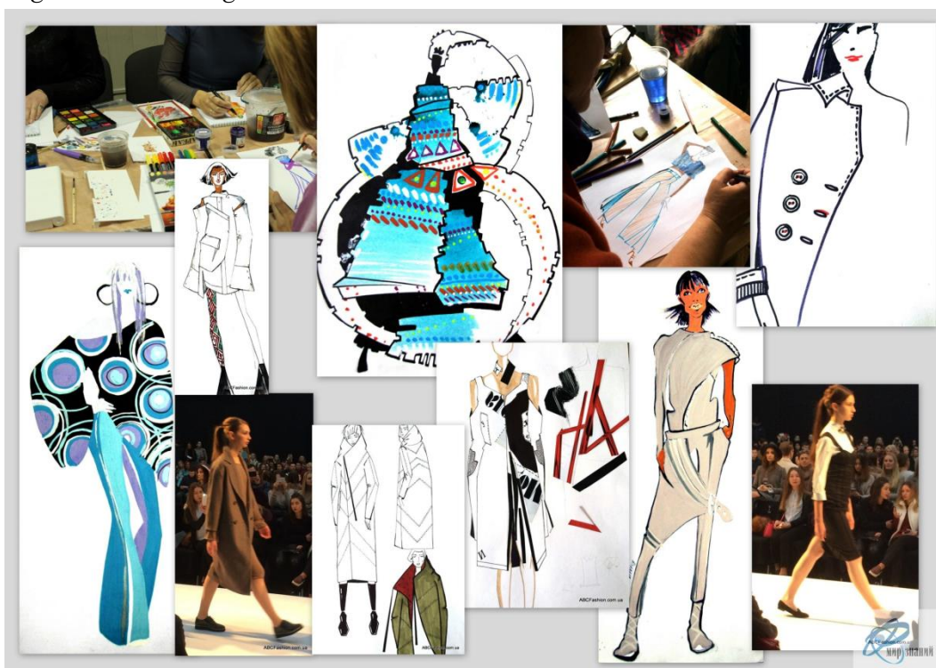
1-rasm. Zamonaviy kostyum dizaynida stilizatsiyalash