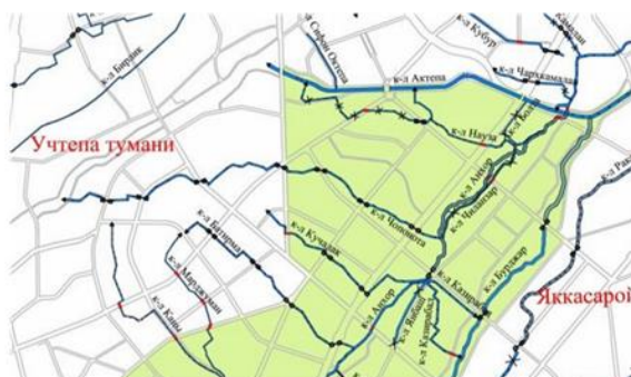
1-расм. Чилонзор тумани бўйлаб оқиб ўтувчи каналлар схемаси

Ушбу қарорнинг натижаси сифатида Анхор бўйи канали сув бўйларини реконструкцияси бўлиб, таъмирдан кейин унинг таниб бўлмас даражада ўзгариб кетганлигини мисол қилиб кўрсатиш мумкиндир. Ўзан тозаланиб, бетонланган, қирғоқлари мустаҳкамланиб, кўркам кўринишга келтирилган, янги тўсиклар ўрнатилган, аҳолини сайр қилиши учун қирғоқ бўйлаб брусчаткалар ўрнатилган, кўкаламзорлаштир ишишлари амалга оширилган.