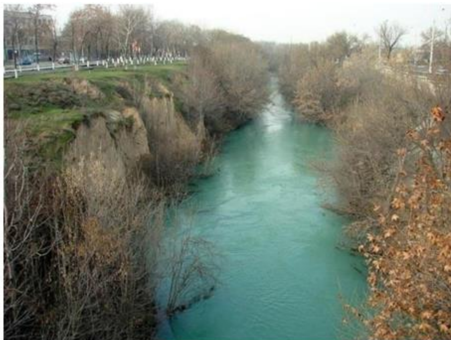
Бозсуга қўйилади. расм. Оқтепа канали

Оқтепа- Тошкентдаги канал, Бурижар каналининг ўнг тармоғидир. У Оқтепа деб номланган тарихий жойлардан оқиб ўтади, канал яқинида Оқтепа Чилонзор шаҳарчаси жойлашган. Каналга «Оқтепа» дебўша жойнинг номи берилган. (Бу ерда эстакада-кўприк қурилган). Кичик халка йулидан унга сувнинг анча кўпайишига сабаб бўлиб қуйи Мирзо Улугбек туманида Қорасув ирригацион каналива Салар канали унча кенг бўлмаган ўзанлари ўтади. Шаҳарнинг энг асосий очик сув оқимлари ўзанининг узунлиги 15,5 кмни ташкил қилади, зичлиги-4,8 м/га. Салар каналига асосий сув Корасув каналидан оқиб тушади. Шуни таъкидлаш муҳимки, Мирзо Улугбек тумани чегарасида Салар каналининг қирғоқлари бетон билан