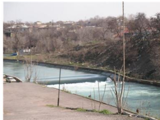
Расмлар. Бўрижар канал