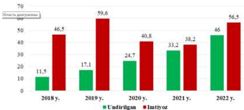
3-rasm. 2018-2022-yillarda undirilgan bojxona to'lovlari va bojxona to'lovlaridan berilgan imtiyozlar (trln so'mda)

Tashqi iqtisodiy faoliyatni bojxona to'lovlari bilan tartibga solishda, tashqi savdoni samarali tarkibini ta'minlash, ichki ishlab chiqaruvchilarni chet elning nosog'lom raqobatidan himoya qilish, to'g'ridan to'g'ri investitsiyalarni jalb qilishni rag'batlantirish maqsadida tovarlarga qo'llaniladigan bojxona to'lovlari va ularning stavkalari hamda bojxona to'lovlaridan beriladigan imtiyoz va preferensiyalar tushuniladi.