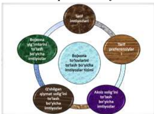
1-Rasm. Bojxona to‘lovlarini to‘lash bo‘yicha imtiyozlar tizimi