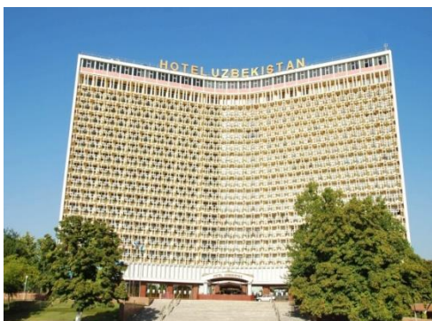
11-расм. “Ўзбекистон” меҳмонхонаси.

Меҳмонхоналар орасида “Ўзбекистон” (11-расм) ва “Чорсу” (12-расм) меҳмонхоналари жуда оригинал бинолар сифатида эътирофга лойиқ. Бу бинолар шаҳарсозлик нуқтаи назаридан қараганда ҳам ўзи жойлашган ҳудудда доминант сифатида кўзга ташланади ва меъморий кўриниши жиҳатидан ўзида миллийликни ва замонавийликни мужассам этади.