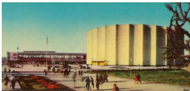
4-расм. А. Навоий номидаги кино саройи.

Спорт иншоотлари орасида “Юнусобод” спорт мажмуаси (7-расм), “Юбилейный” муз саройи (8-расм) ҳам диққатни ўзига жалб этади.