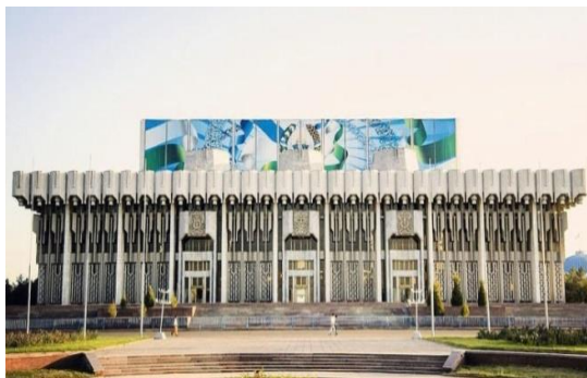
3-расм. Халқлар дўстлиги саройи.

Маданият объектларига мисол тариқасида кўплаб ноёб биноларни келтириш мумкин. Улар орасида Халқлар дўстлиги саройи” (3-расм), А. Навоий номидаги кино саройи (4-расм), Тарих музейи (5-расм), “Туркистон” саройи, цирк биноси (6- расм), кўргазмалар зали алоҳида аҳамиятга эга иншоотлар ҳисобланади.