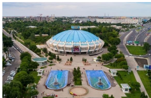
6-расм. Цирк биноси.