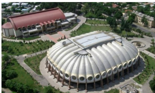
7-расм. “Юнусобод” спорт мажмуаси. 8-расм. “Юбилейный” муз саройи.

Савдо иншоотларидан “Тошкент” универмаги (ЦУМ) (9-расм), “Тошкент” савдо маркази (ГУМ) ноёб иншоот сифатида юқоридаги рўйхатдан ўрин олишга ҳақли. Чорсу бозорининг ёпиқ биноси ҳам шаҳарнинг ташриф қоғозига айланиб улгурган (10-расм).