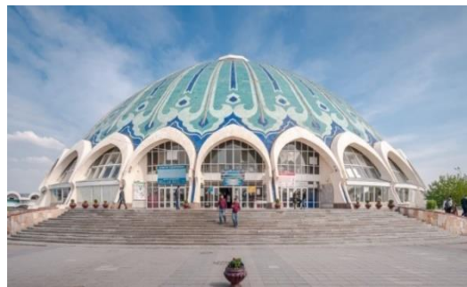
10-расм. Чорсу бозорининг ёпик биноси.

Меҳмонхоналар орасида “Ўзбекистон” (11-расм) ва “Чорсу” (12-расм) меҳмонхоналари жуда оригинал бинолар сифатида эътирофга лойиқ. Бу бинолар шаҳарсозлик нуқтаи назаридан қараганда ҳам ўзи жойлашган ҳудудда доминант сифатида кўзга ташланади ва меъморий кўриниши жиҳатидан ўзида миллийликни ва замонавийликни мужассам этади.