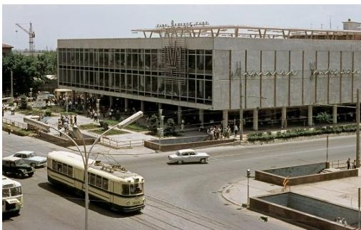
9-расм. “Тошкент” универмаги.