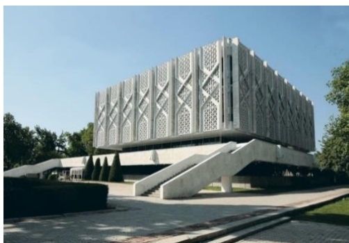
5-расм. Тарих музейи.

Афсуски “Юбилейный” муз саройи қайта реконструкция қилиниб, кўргазмалар залига айлантирилди. Унинг реконструкциядан кейинги кўриниши, албатда, киши эътиборини ўзига жалб эта олади деб бўлмас эди. Ҳозирги кунга келиб, муз саройи ўзининг асл ҳолига келтириш мақсадида қайта реконструкция қилинмоқда.