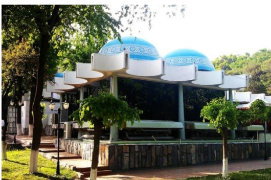
13-расм. “Мовий гумбазлар” кафеси.

Умумий овқатланиш муассасалари орасида “Мовий гумбазлар” кафеси (13-расм), “Зарафшон” ресторани ва “Самарқанд” чойхонасини (14-расм) ўз даврининг кўзга кўринган ноёб иншоотлари қаторига қўшиш мумкин. Афсуски, “Зарафшон” ресторани ва, айниқса, “Самарқанд” чойхонаси кўп ўзгаришларга дуч келди ва ташқи кўринишининг ўзгариши билан бирга функционал жиҳатдан ҳам моҳиятини ҳам йўқотган.