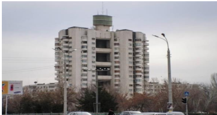
2-расм. 16-қаватли турар-уй. "Жемчуг".