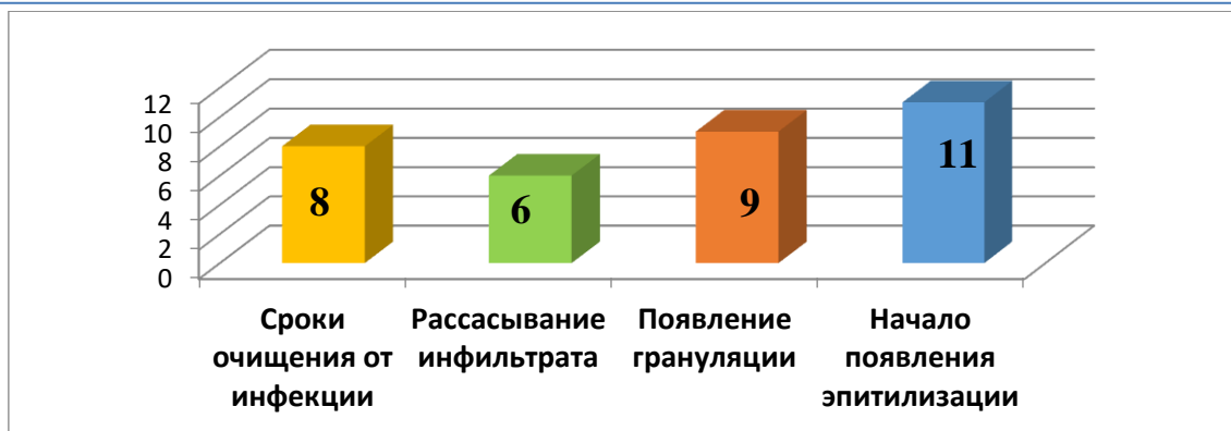
Рис. 2. Сроки очищения и заживления раны у больных I группы сравнения с гнойно-некротическими заболеваниями (n=86)

Результаты анализа сроков очищения и заживления раны у больных II группы, приведенные на рисунке 5 свидетельствуют, что у больных анализируемой группы очищение ран от инфекции происходило в среднем к 8,0 \pm 0,5 суткам. К шестым суткам отмечалось рассасывание инфильтратов.