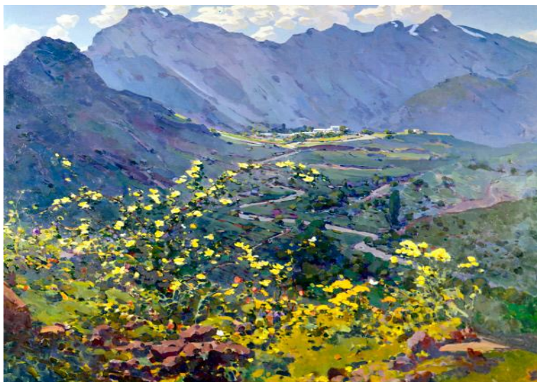
“Mening qushig'im” 1967 y.