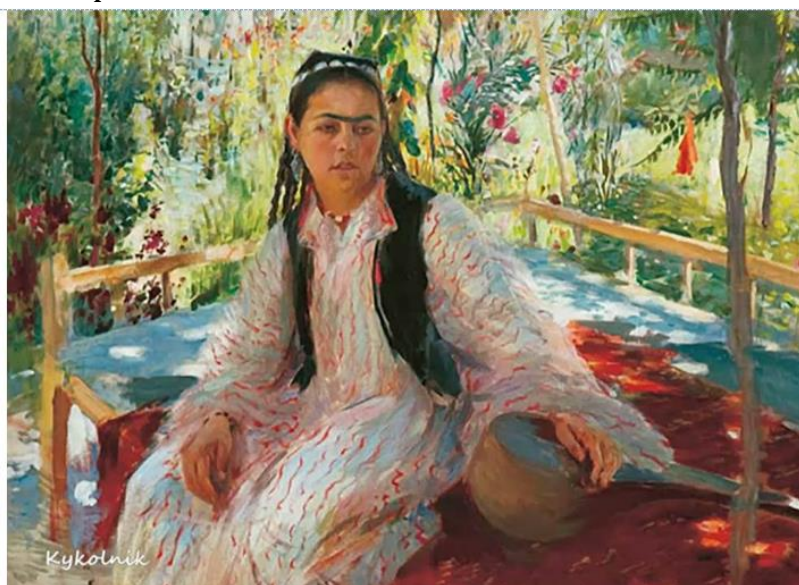
“Dutorchi qiz” 1947 y.

Kadrdon ulkasi hayotiga daxldorlikni his qilish, O'rta Osiyoning betakror uziga hosligidan, uning maftunkor guzalligidan faxrlanish rassomning eng yaxshi asarlarida uz aksini topdi.