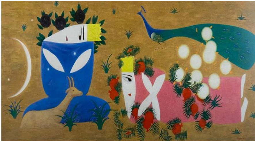
“Sevishganlar xaqida afsona” 2001 y.

Qodirov G'. 1958Mato, moybo'yoq. 80x180 sm.