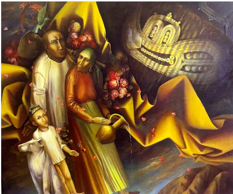
“Sirdaryo” 1985 y.