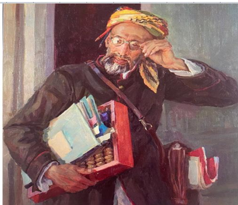
“Tabelchi” 1958 y.