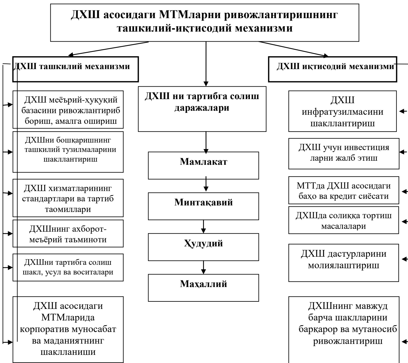
1-расм. ДХШ асосидаги МТМларни ривожлантиришнинг ташкилий-иқтисодий механизми

Инфратузилмани ривожлантириш масалалари шу кунгача анъанавий равишда давлат томонидан молиялаштирилиб келинган ва яқин вақтгача республикамизда инфратузилма ривожланишини молиялаштиришда хусусий сектор иштироки учун меъёрий-ҳуқуқий, қонунчилик асос йўқ эди. Бироқ, кейинги 5 йилда кенг равишда ижтимоий аҳамиятга молик бўлган лойихалар ( таълим, ичимлик суви, соғлиқни сақлаш ) ва аралаш тузилмаларни молиялаштиришнинг турли моделлари пайдо бўлди.