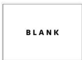
Design My Own