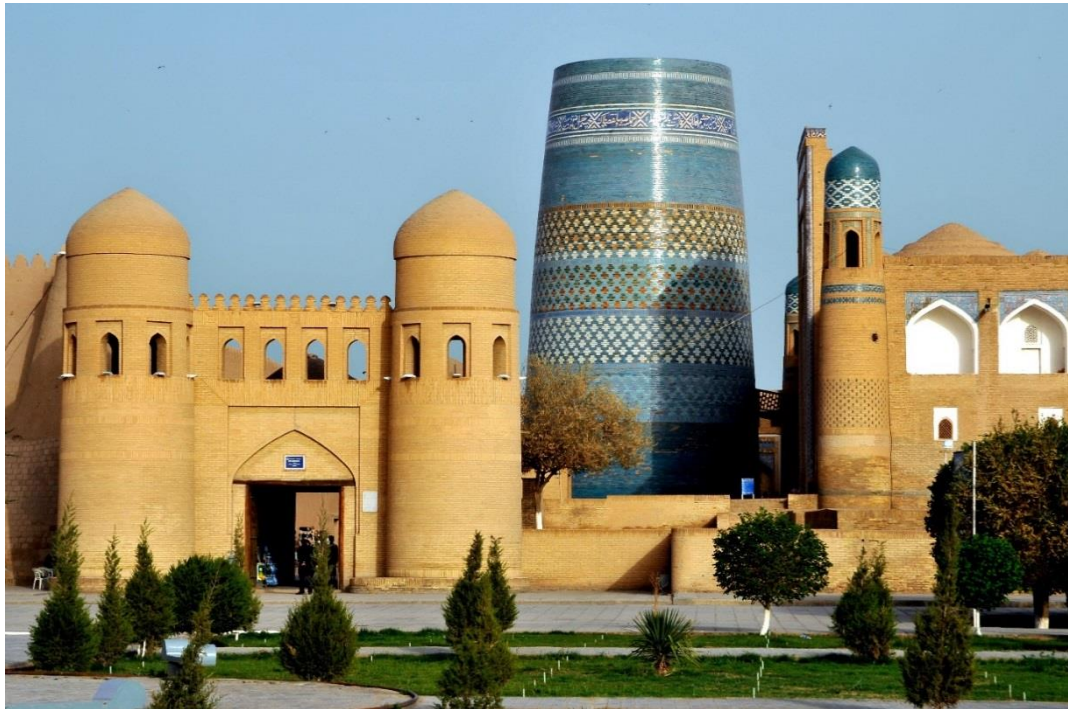
Xiva Kalta Minor (rasm 1)

Iroq va O'rta Osiyoda "minora", Misr, Quvayt kabi davlatlarda "mezana", Arab yarim orolining g'arbida "suvma'a" deb ataladi, bizning yurtimizda yoshu-keksa minora so'zi bilan yaxshi tanishadi. Masjidlarimizni minorasiz tasavvur qila olmaymiz, ayniqsa qadimiy masjidlarimiz haqida so'z ketganda Buxorodagi "Minorai Kalon", Xorazmdagi "Kalta minora", zamonaviy minoralardan Ko'kcha dahasidagi "Shayx Zayniddin" minoralarini bilmaydigan hamyurtlarimiz topilmasa kerak. Ular o'tmishdan xabar berib, hali hanuz savlat to'kib turibdi.