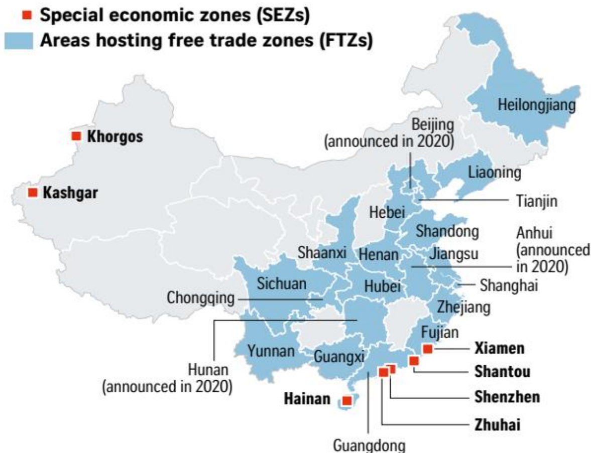
1-rasm. Xitoyda EIZ (erkin iqtisodiy zona) va MIZ (maxsus iqtisodiy zona)lar va ularning joylashuvi 16 .

Tadbirkorlik sohasi uchun infrastrukturani yaratishning samarali usullaridan biri – bu MIZ hamda EIZlarni tashkil etishdir. Bu usul Xitoy tajribasida yaxshi samara bergani ko'rish mumkin.