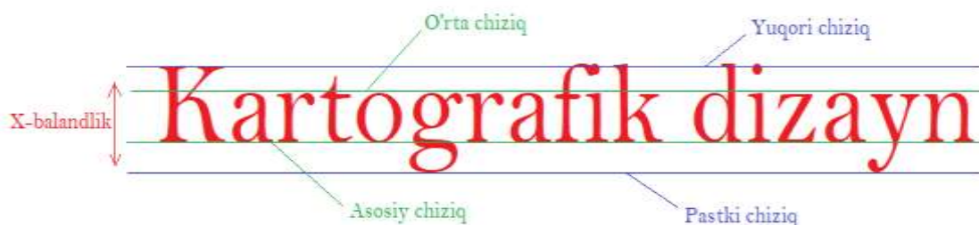
4-rasm. Bazali chiziqda harflarning joylashishi

Shriftlar. Harf va raqamning ayrim elementlari kengligi, balandligi, yo'g'onligi, rasmning qanday holatdaligiga ko'ra aniqlanadi. Shriftli belgilar orqali asosiy elementlar (yo'g'on chiziqlar), qo'shimcha elementlar (birlashma hosil qiluvchi shriftlar, burchaklarni birlashtiruvchi, tomchisimon elementlar, tubi qirzilgan elementlar) va harfning ichki qismi yorug'liklarini tasvirlashi mumkin. Ular orasidagi farqlarni kartografik shrift turiga qarab, xarakterlash mumkin.(4-rasm)