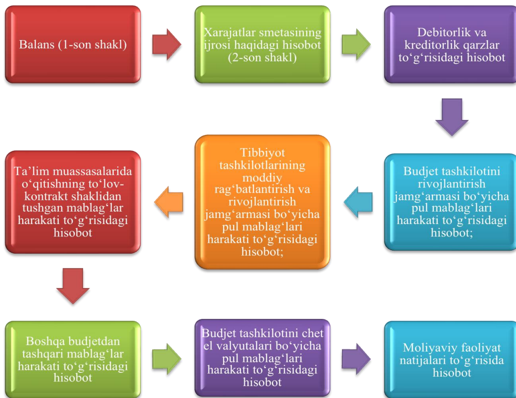
2-rasm. Budjet tashkilotlarida topshiriladigan yillik moliyaviy hisobotlar. 23

Budjet tashkilotlari va budjet mablag'lari oluvchilarning choraklik hamda yillik moliyaviy hisobotlarni tuzish, tasdiqlash va taqdim etish tartibi O'zbekiston Respublikasi Moliya vazirligi tomonidan belgilanadi.