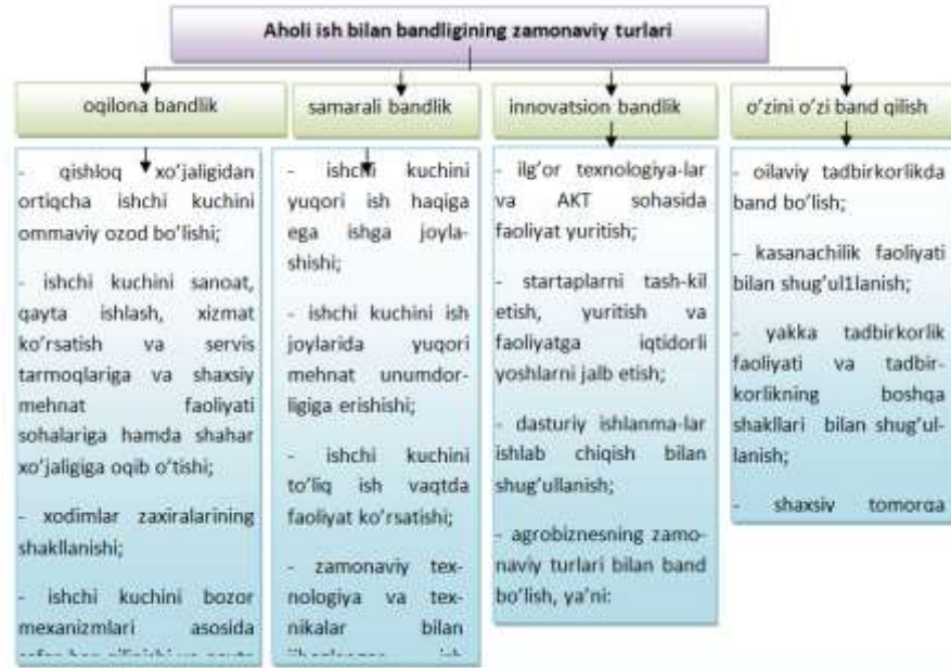
1-rasm. Aholi ish bilan bandligining zamonaviy turlari 149

Aholining ish bilan oqilona bandligi ishchi kuchiga talab va taklif o'rtasidagi moslikga erishishni anglatadi.