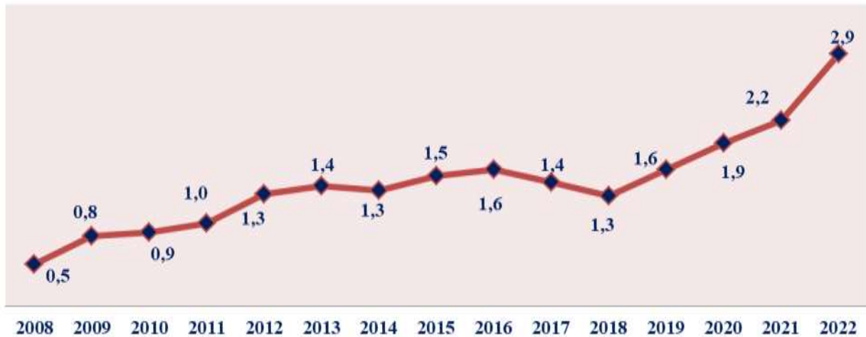
Озиқ-овқат маҳсулотлари импорти (млн. АҚШ доллар)

Шу аснода, ички бозорда нархлар барқарорлигини таъминлаш, аҳоли фаровонлигини ошириш ва Жаҳон савдо ташкилоти талаблари асосида импорт товарлари учун тариф имтиёзларини қўллаш асосий восита бўлиб ҳисобланмоқда.