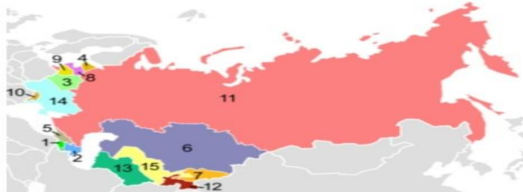
Sobiq Sovet davlatlari:

Sobiq Sovet davlatlari (sobiq Sovet Ittifoqi nomi bilan tanilgan [1] ) 1991-yilda Sovet Sotsialistik Respublikalari Ittifoqi parchalanganidan keyin qayta paydo bo'lgan 15 ta suveren davlatlardir.