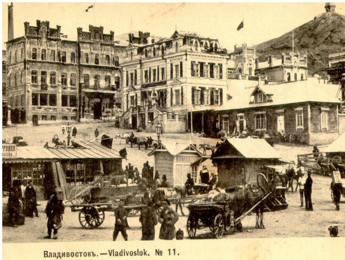
Владивостокъ. — Vladivoslok. № 11.

mashhur shaklda Rossiyaning sharqiy mintaqalari rivojlanishining asosiy tarkibiy qismlari: hududning shakllanishi, aholi punkti, geografik o‘rganish va iqtisodiy rivojlanish haqida gapiradi. Topografiyada allaqachon nashr etilgan manbalardan tashqari yangi arxiv materiallaridan foydalanilgan. Mualliflar keng arxiv materiallariga tayangan.