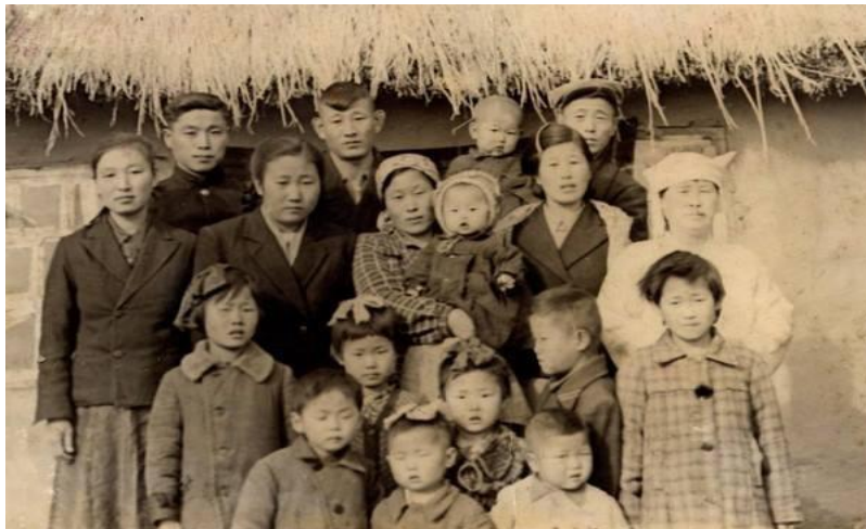
4-rasm. 1940-yilda Toshkent shahridagi koreys oilasi.