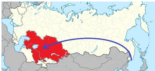
2-rasm. 1937 yilda Sovet Ittifoqiga koreyslarni deportatsiya qilish yo'li.

Ko'chirish Posyetskiy tumani va Grodekovoga tutash tumanlardan boshlanishi kerak bo'lgan. Ko'chirish zudlik bilan davom ettirish 1938-yil 1-yanvargacha yakunlanishi belgilangan. Qarorda ko'chirilayotgan koreyslarga ko'chirish vaqtida o'zlari bilan mol-mulk, uy jihozlari va chorva mollarini olib ketishlariga ruxsat berilgan. Ko'chirilgan odamlarga ko'char va ko'chmas mulk va ular qoldirgan ekinlari uchun tovon to'lash ko'zda tutilgan. Chegarani kesib o'tishning soddalashtirilgan tartibini ta'minlab, ko'chirilgan koreyslarning xohlasa, chet elga chiqib ketishiga to'sqinlik qilmaslik ham belgilangan.