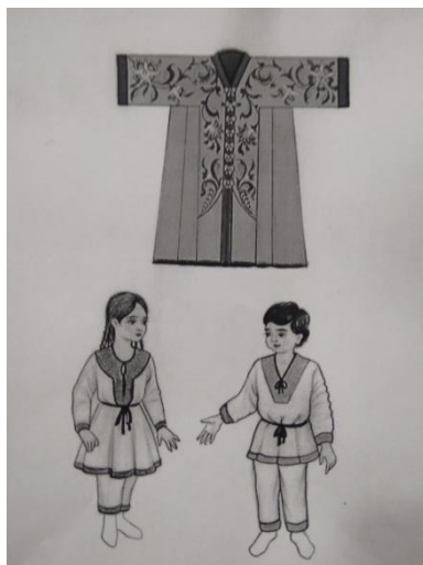
1-расм. Аёл ва болалар устбошлари

Мато қолдиқлари эркаклар тобутларида ҳам учрайди. Хуллас, Мунчоқтепадаги мато-кийим қолдиқлари асосида ижодий ва илмий ишлар олиб борилди. Эраққ, аёл ва болалар устбошларини эскизлар асосида тиклаш имкон беради. (1-расм).