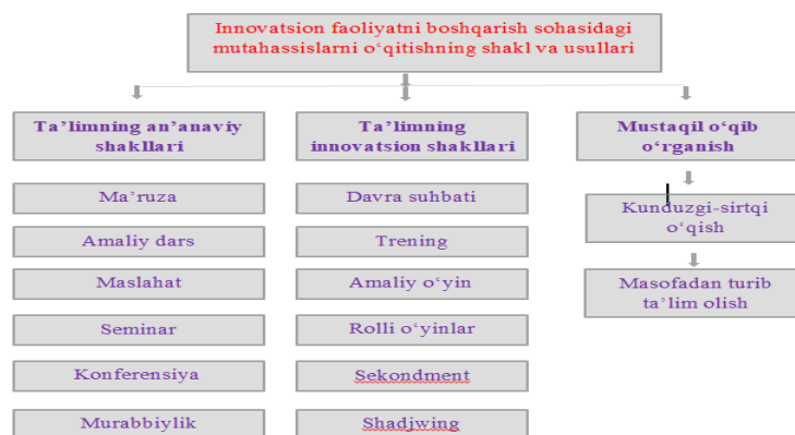
1-rasm. Innovatsion faoliyatni boshqarish sohasidagi mutaxassislarni o'qitishning shakl va usullari

Buddyingning mohiyati shundan tobora ortib borishi tahsil oluvchilarga qisqa vaqt ichida katta hajmdagi bilimlarni berish, materialni amaliyotda mustahkamlagan holda uni o'zlashtirishning yuqori darajasini ta'minlash imkonini beruvchi innovatsion shakllarni talab qiladi. Umumiy tendensiya faol o'qitish shakllaridan foydalanish va tinglovchilarda jamoaviy ish ko'nikmalarini rivojlantirishga ko'proq e'tibor qaratilishidan iborat.