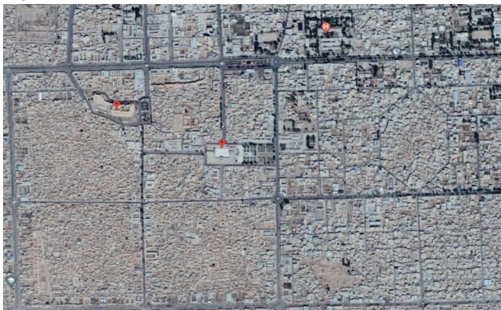
1-rasm. Alisher Navoiy davri Hirot shahri (histori)ning yuqoridan ko'rinishi.

Bog'ning bog' bo'lishi, yashab gurkirashi uchun birinchi navbatda suv masalasi to'g'ri hal qilingan bo'lishi lozim. O'tmishda bunyod etilgan bog'lar daryolardan qazilgan kanallar, maxsus rezervuarlar, tabiiy buloqlar suvi, ko'llar, katta ariqlar suvi bilan sug'orilgan. Kanallardan tortilgan ariqlar nafaqat bog'larni, balki bog'lardagi hovuzlarni ham suv bilan ta'minlagan. Ariqlarga uzilib tushgan turli rangdagi olmalar ariqlardan hovuzlarga oqib, kishi ko'zini quvontirgan.