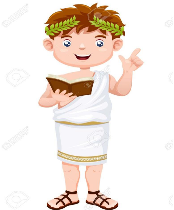
The Greek Alphabet